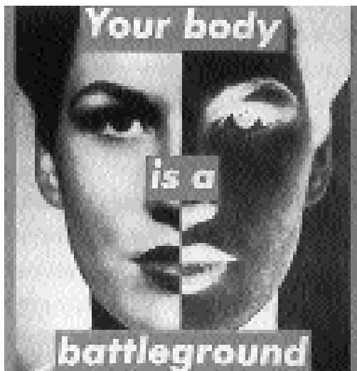
Barbara Kruger. «O teu corpo é un campo de batalla».

Tamén é unha filosofía con importantes pensadoras que tratan de fundamentar as causas das desigualdades e profundar nelas abrindo canles de superación. Entre outras están: Simone de Beauvoir, Carol Pateman, Sheyla Benhabib, Carol Gilligan, Amelia Valcárcel, Adela Cortina, Victoria Camps, Celia Amorós, etc.